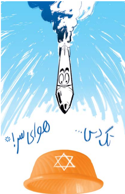
* موشک مسلط به گویش طبری!

*تشت لاک: به لکن (تشت پلاستیکی) در مازندران گویند. از کاربردهای جانبی این ابزار کارآمد در منازل، بهره‌گیری موسیقایی و حرارت‌بخشی به جمع‌های خانوادگی است. به طوری که در بین سازهای کوبه‌ای، رقیب جدی تنبک به شمار می‌رود. گفتنیست برخی پژوهشگران، خاستگاه ساز جدید هنگ‌درام (hang drum) را تشت‌لاک می‌دانند. با این همه، با گذشت زمان همچنان کاربردهای تازه‌ای از این ابزار کشف می‌شود. جدیدترین مشاهده محققان حاکی از استفاده تشت‌لاک در صنایع دفاعی رژیم صهیونیستی است. این مشاهدات مؤید خاصیت سوق‌الجیشی این شیء رازآلود و آغازگر باب تازه‌ای در مصنوعات جنگی خواهد بود.